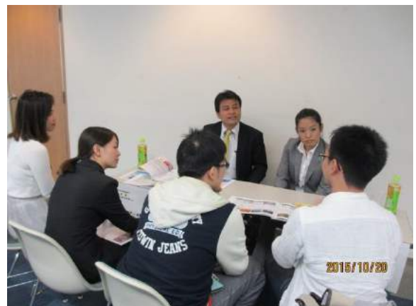
第 2 部企業と留学生の交流会