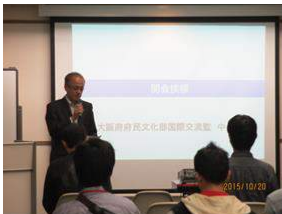
第 1 部【講義】日本の企業で働くために